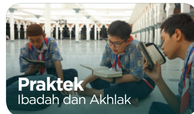
Praktek Ibadah dan Akhlak