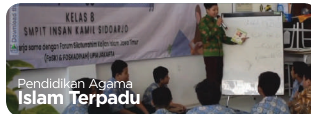
Pendidikan Agama Islam Terpadu